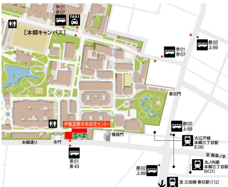
ホールへのアクセス